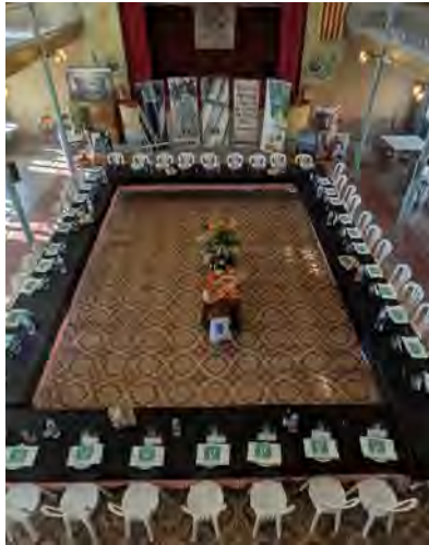
Societat Agrícola i Secció de Crèdit de Valls, SCCL