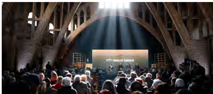
Cellers Domenys i Secció de Crèdit, SCCL