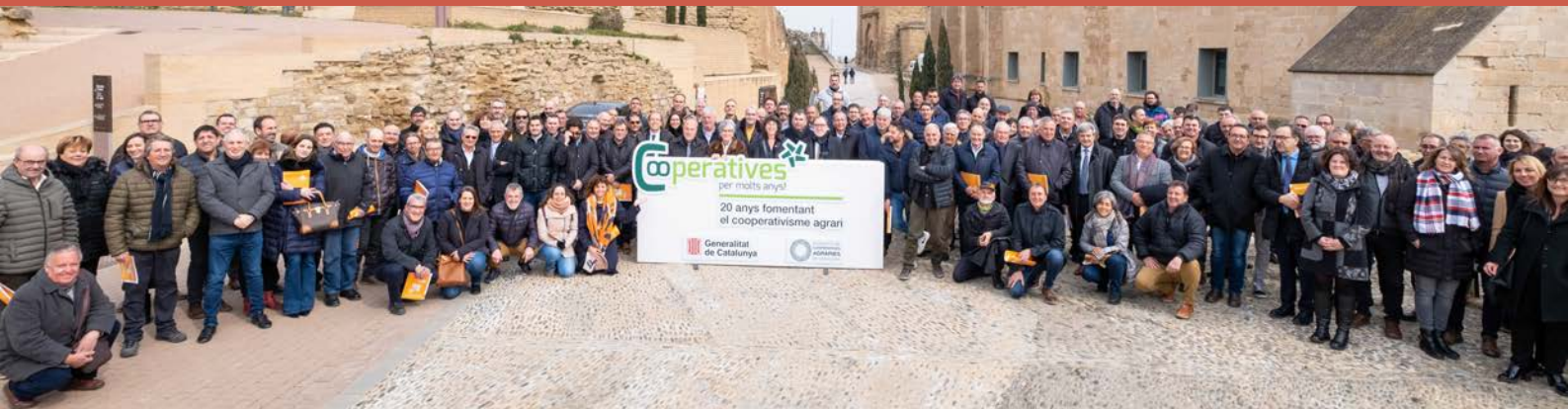
Acte de celebració, a Lleida, dels 20 anys d'Intercooperació