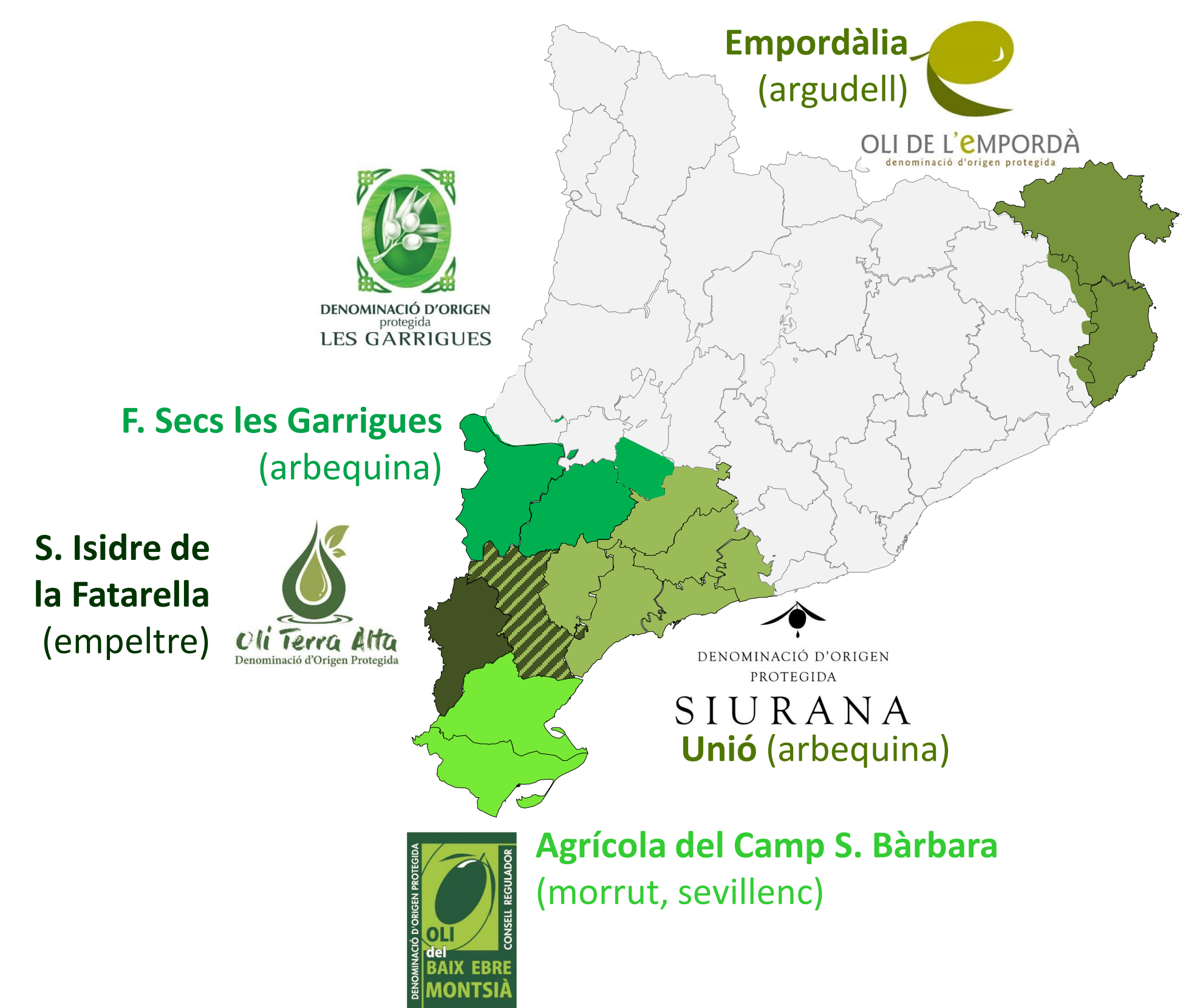
Figura 1.- Entidades participantes en el proyecto, DO de Aceite de Oliva de Cataluña a la que pertenecen y variedad mayoritaria